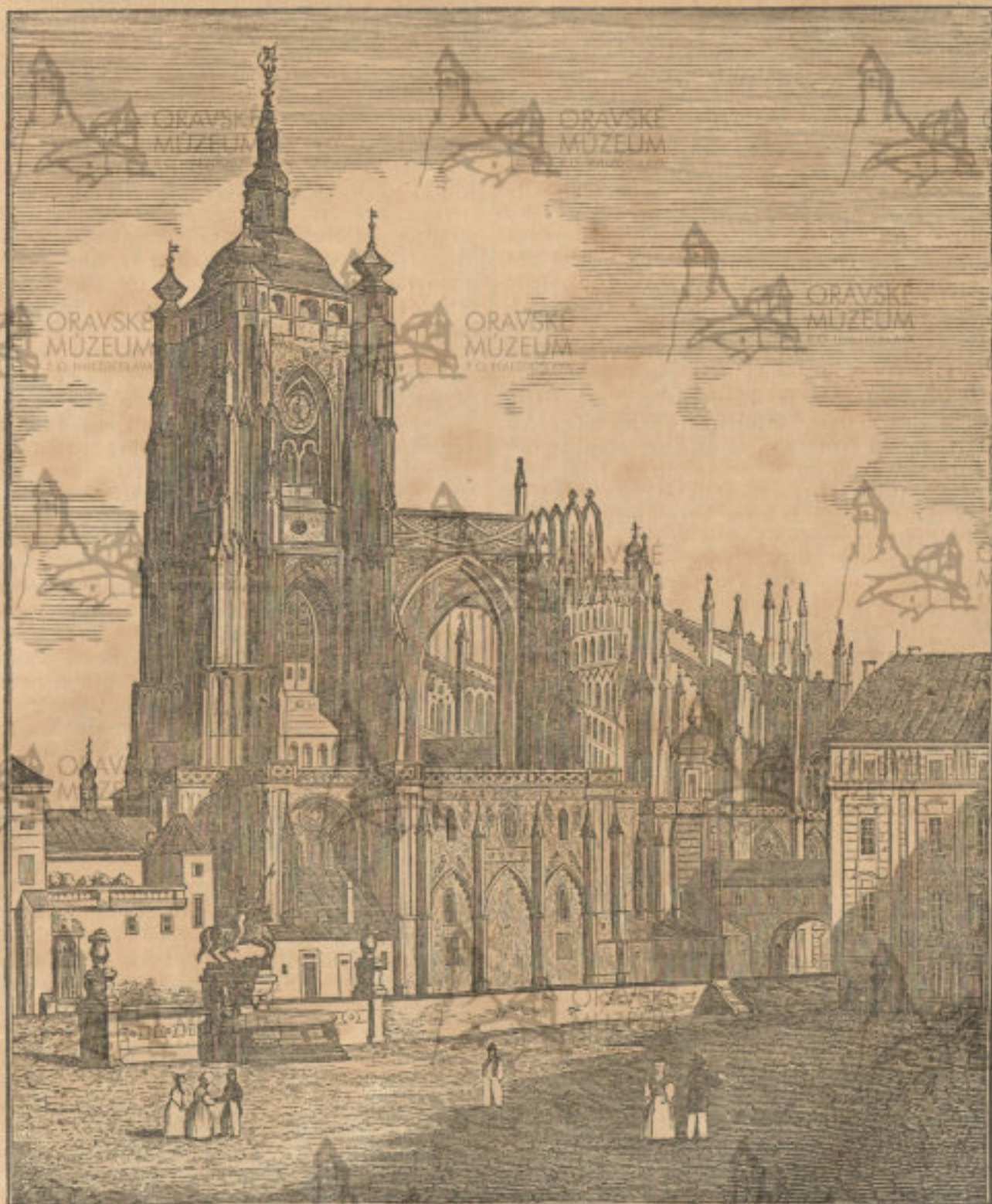
Hlavní chrám sv. Víta v Praze.